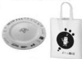
メイン・サブ会場 学校会場 記念品(2018年の例)