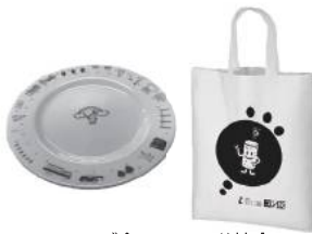
メイン・サブ会場 学校会場 記念品(2018年の例)