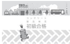
合格カード(2018年の例)

上級合格者が対象で、その道のプロでも少し冷や汗が出るレベルですが、コン検受験者から「おがまれる」レベルの検定です。合格点は受験者の得点率等により決定します。更に合格しても何回でも受験出来ます。(合格者には素敵な記念品を差し上げます!)