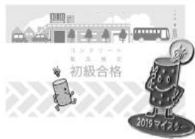
合格カード(初級・中級・上級) & ピンバッジ(マイスター) 2019

上級合格者が対象で、その道のプロでも少し冷や汗が出るレベルですが、コン検受験者から「おがまれる」レベルの検定です。合格点は受験者の得点率等により決定します。更に合格しても何回でも受験出来ます。(合格者には限定ピンバッジを差し上げます!)