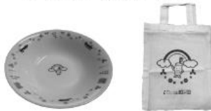
メイン・サブ会場 学校会場 記念品(2019年の例)